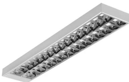
Figura 02 – Luminária Tubular com Aletas de Alumínio com Duas Lâmpadas de LED 1,2m de 18W.