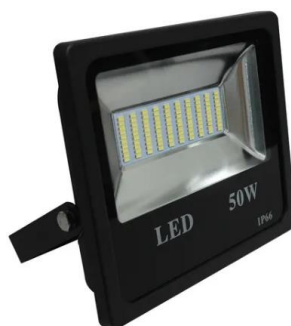
Figura 03 – Refletor de LED 50W