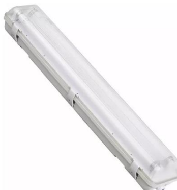
Figura 04 – Luminária Hermética Tubular com Duas Lâmpadas de LED 1,2m de 18W.