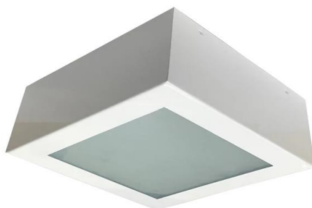
Figura 01 – Luminária Tipo Plafon Quadrado com Duas Lâmpadas de LED 10W.